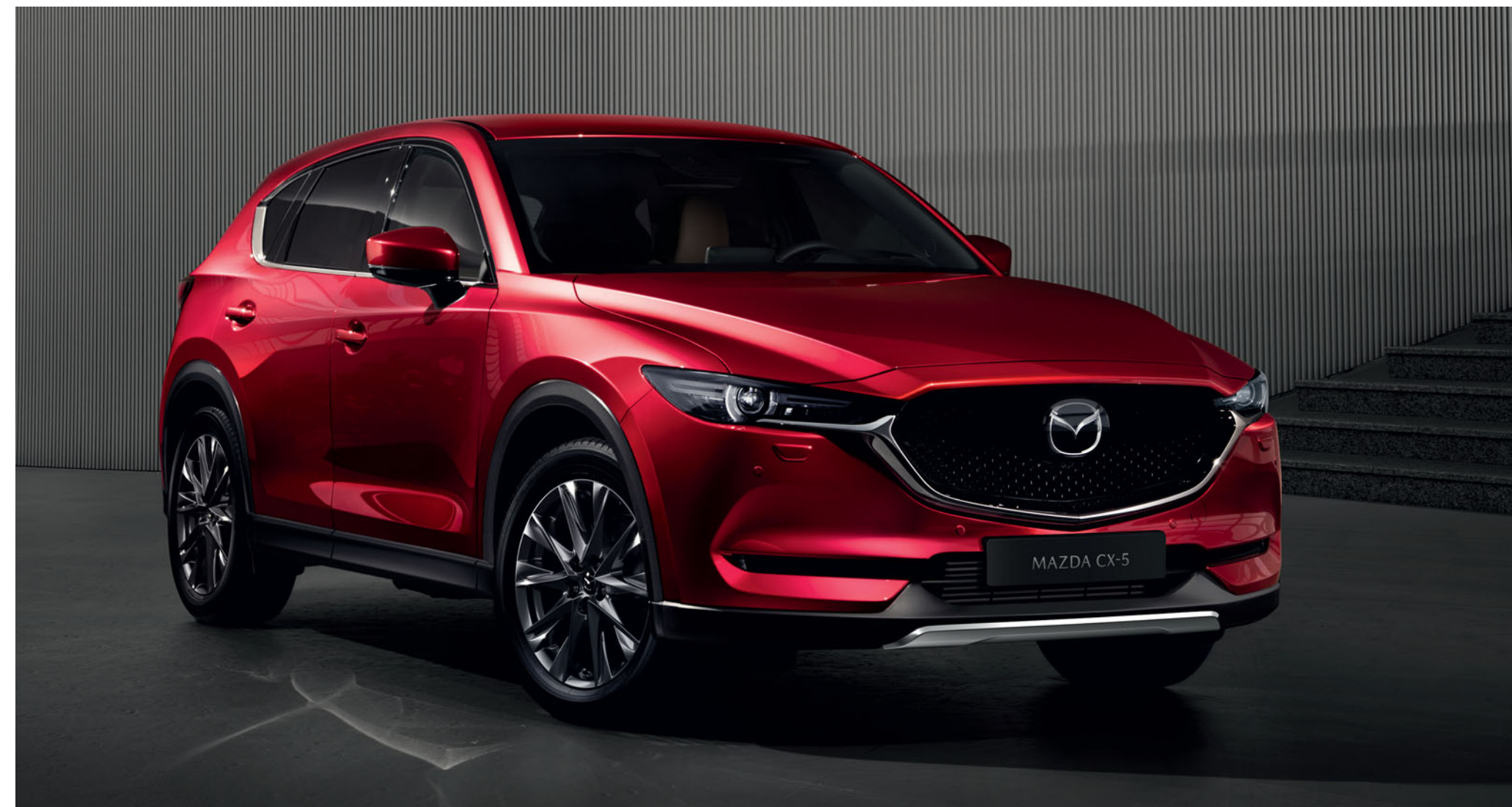
Ornament argintiu spoiler față