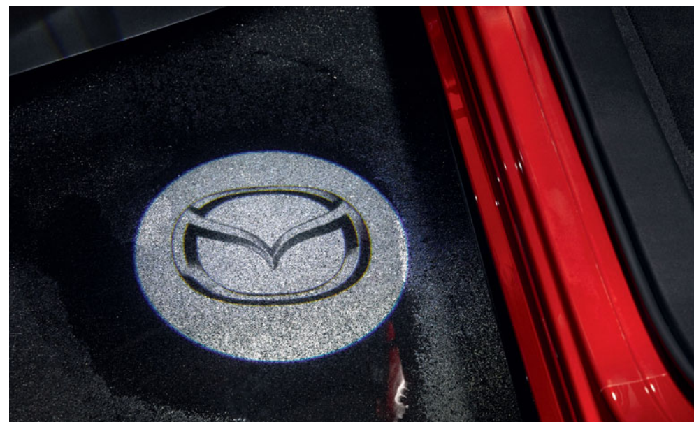
Logo Mazda proiectat cu lumină LED