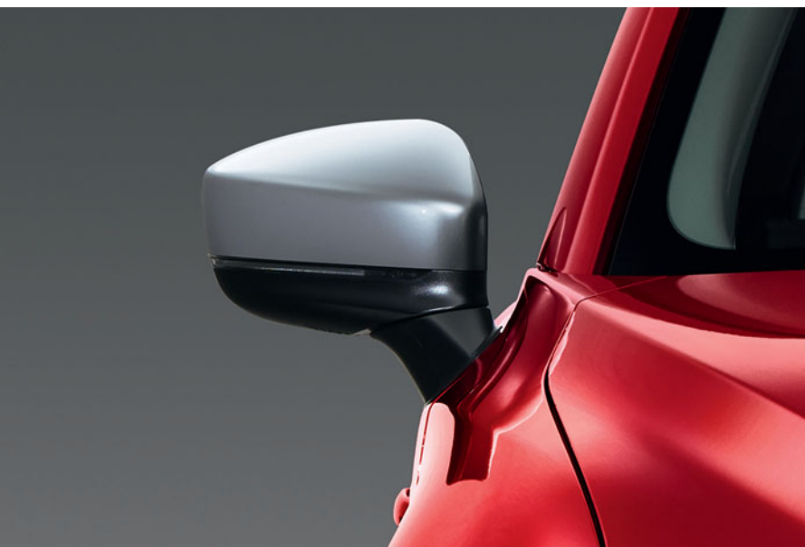
Capace oglinzi argintii

Mazda a creat accesorii proiectate cu atenție care funcționează perfect cu Mazda CX-5. Pentru o listă completă de accesorii originale Mazda vizitează site-ul www.mazda.ro