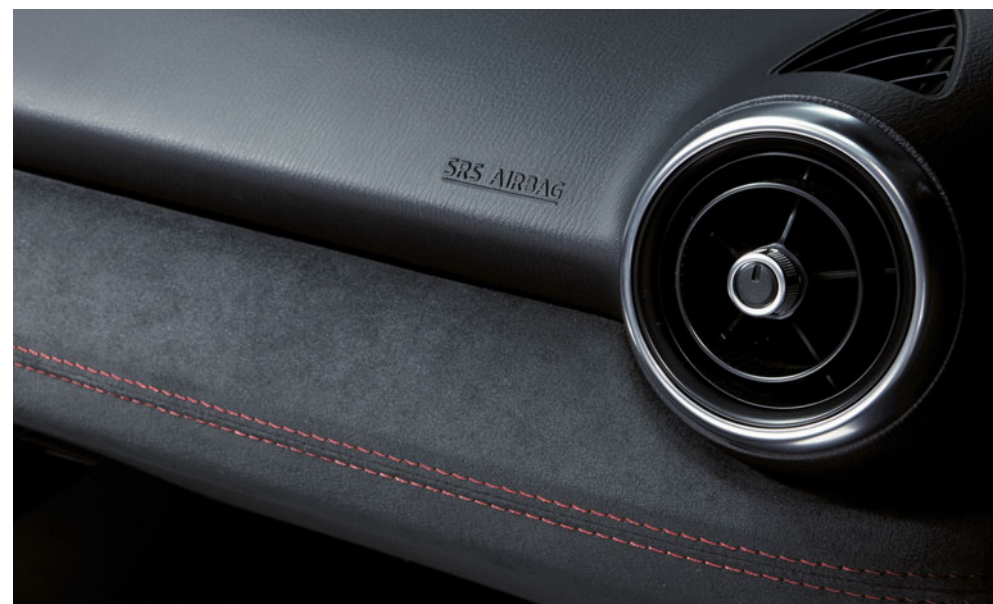
Panou de bord luxos, îmbrăcat în Alcantara®