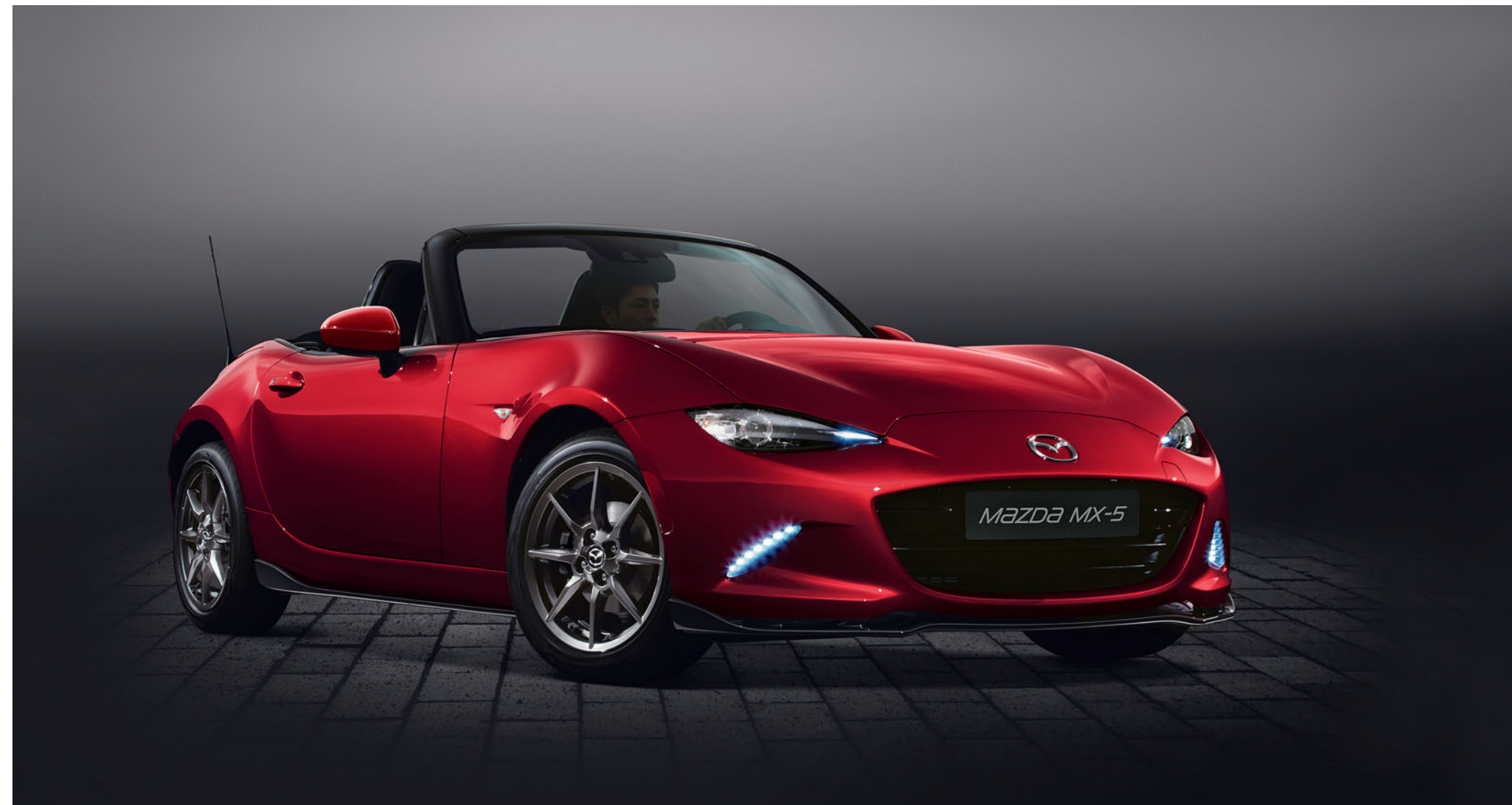
Praguri exterioare frontale și laterale negru lucios