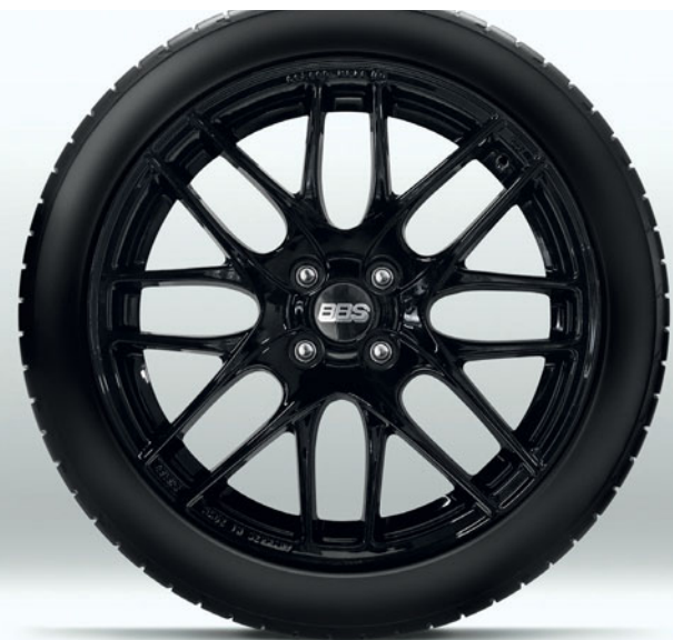
Jante negre din aliaj BBS de 17"

Mazda a creat accesorii proiectate cu atenție care funcționează perfect cu Mazda MX-5. Pentru lista completă de accesorii originale Mazda MX-5, contactează dealerul tău.