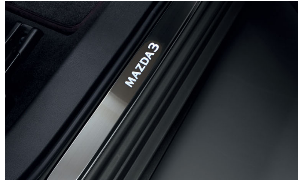
Ornamente Praguri Iluminate