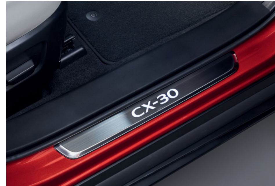
Ornamente iluminate praguri

Mazda a creat accesorii proiectate cu atenție care funcționează perfect cu Mazda CX-30. Pentru o listă completă de accesorii originale Mazda, vizitează dealerul tău Mazda.